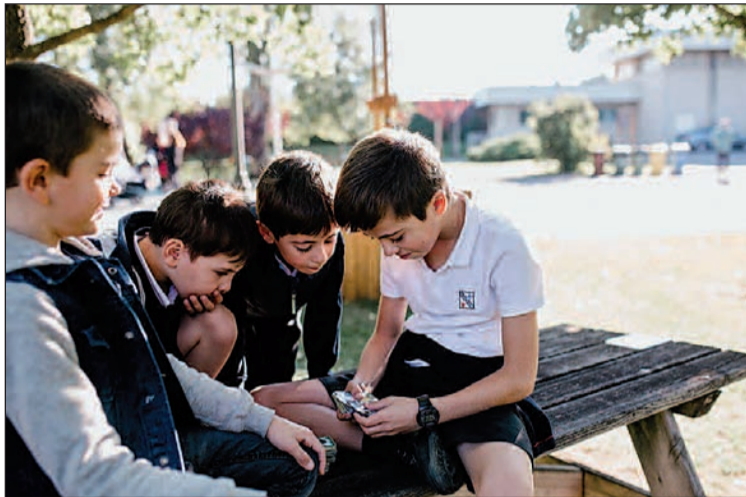
La actividad está dirigida a niños de 6 a 18 años.

La actividad extraescolar que proponen se trata de una reunión semanal, con un ambiente distinto al escolar, en la cual sus participantes comparten la semana vivida y se trabajan aspectos concretos que los niños y jóvenes viven. “Desde el conocimiento de la realidad, se toman decisiones concretas, reales y alcanzables para la semana siguiente”, apuntan. La clave de UpToYou, detallan, “es que se centra en la persona y en su realidad concreta y lo hace desde lo más singular que una persona tiene: sus emociones”. “En lugar de ver problemas que resolver, nos centramos en descubrir las